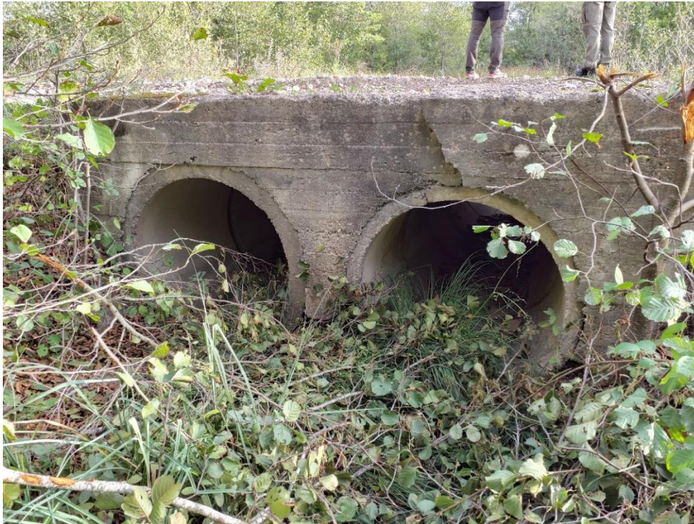
Joonis 2. Türdu jõel paiknev amortiseerunud binokkeltruubi väljavool ehk vaadatuna Tõula järve suunas.

c) Ülevaade objektist ning paikvaatluse (19.09.24) pildid (autor Anett Reilent kui pole märgitud teisiti);