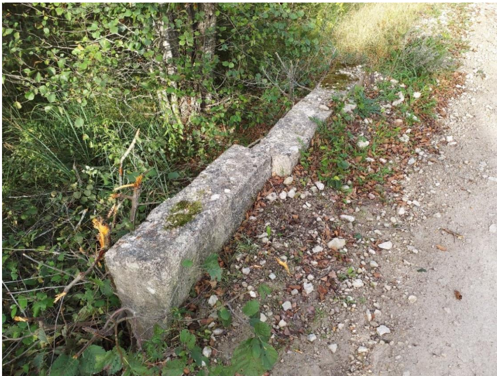
Joonis 3. Türdu jõel paikneva truubi ära nihkunud betoonosa.