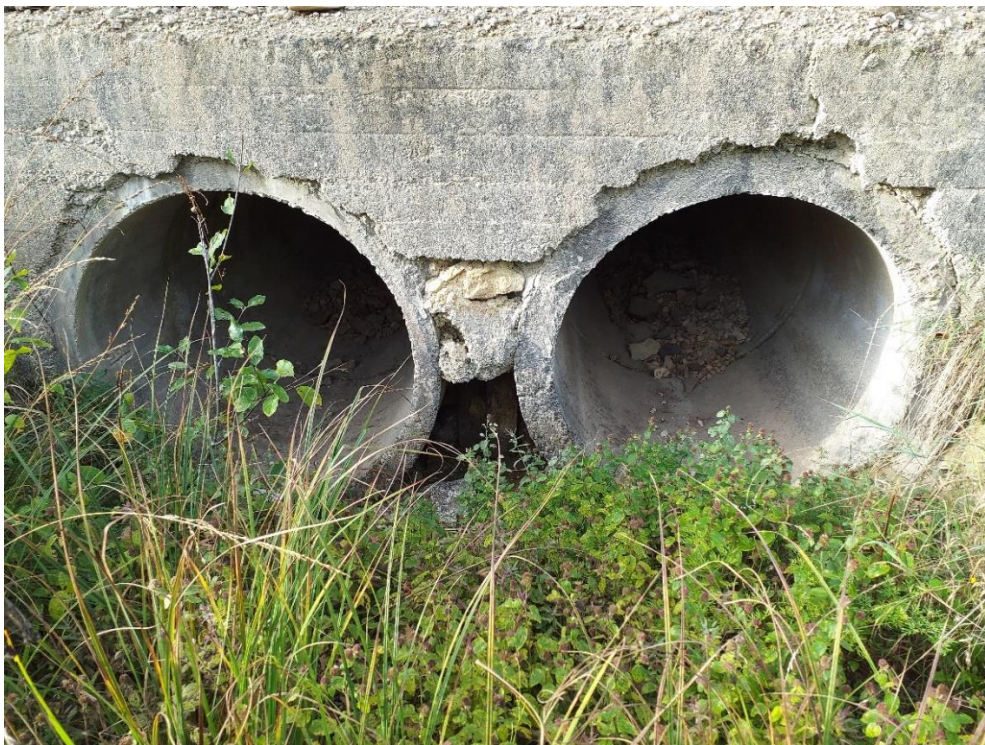
Joonis 4. Türdu jõel paikneva binokkeltruubi sissevool ehk vaadatuna mere suunas.